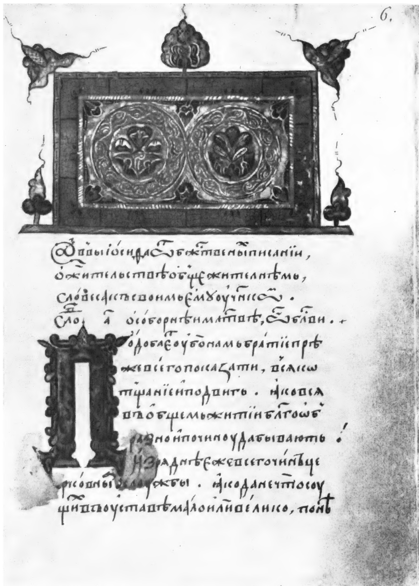
Монастырский «Устав» Иосифа Волоцкого (краткая редакция).